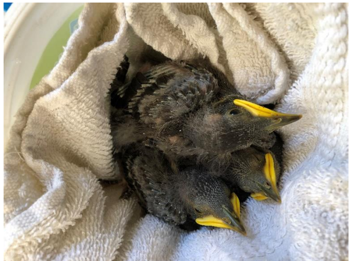
Figuur 5 Jonge Spreeuwen, zie toelichting foto's voor meer info

Volgens het contract met de gemeente Utrecht hebben wij als vogelopvang een jaarlijks bedrag van ca. 68.000 euro mogen ontvangen voor de bekostiging van de vogelopvang Utrecht. Hiermee is de gemeente Utrecht onze grootste subsidieverstrekker. Het gehele dierenwelzijnsbeleid, van de gemeente Utrecht, is uitbesteed aan de Dierenbescherming als hoofdaannemer. De Vogelopvang Utrecht is in dit geheel een ketenpartner.