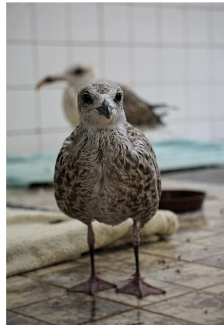
Figuur 2 Jonge meeuw, zie toelichting foto's voor meer info

In 2020 hebben we 42% van de vogels weer los kunnen laten en 6% herplaatst. De herplaatsing betrof voornamelijk roofvogels, uilen, ooievaars, ganzen en zwanen. Deze werden bij andere opvangcentra geplaatst omdat wij hier niet de juiste ruimte hebben om ze (langdurig) te laten herstellen. Goed om te melden is dat het percentage euthanasie is gestegen en het percentage spontaan overleden (dood) omlaag is gegaan. Vanuit het oogpunt van dierenwelzijn is dit een gunstige ontwikkeling omdat ook bij het overlijden van dieren, doodstrijd en stress ontstaat.