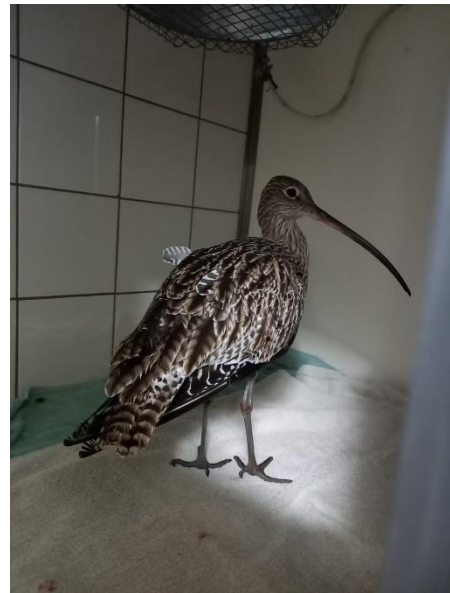
Figuur 6 Wulp, zie toelichting foto's voor meer info

In de komende jaren zal het bestuur, met inzet van medewerkers en het team van betrokken vrijwilligers en in nauw overleg met onze ketenpartners gaan werken aan de stappen die gezet moeten worden om op de huidige locatie Rotsoord een solide professionele (stads) Vogelopvang te realiseren. Hiervoor wordt ook samengewerkt met Kinderboerderij Groen Nieuw Rotsoord voor herindeling van het terrein van Rotsoord. Daarnaast zal de basis gelegd worden voor de noodzakelijke groei naar een extra locatie van de Vogelopvang in de regio Utrecht.