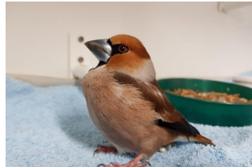
Figuur 7 Appelvink, zie toelichting foto's voor meer info

Rotsoord 24a 3523 CL Utrecht Telefoon: 030-251 72 55 E-mail: info@vogelopvangutrecht.nl www.vogelopvangutrecht.nl