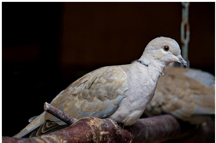
Figuur 3 Turkse Tortel, zie toelichting foto's voor meer info

In verband met corona is de voorlichting op externe locaties tijdelijk stopgezet.