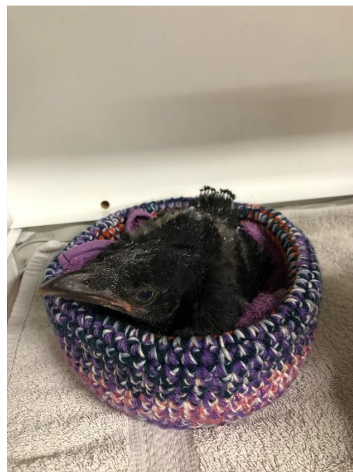
Figuur 4 Jonge Kraai, zie toelichting foto's voor meer info

Volgens het contract met de gemeente Utrecht hebben wij als vogelopvang een jaarlijks bedrag van 68.00 euro mogen ontvangen voor de bekostiging van de vogelopvang Utrecht. Hiermee is de gemeente Utrecht onze grootste subsidieverstrekker. Het gehele dierenwelzijnsbeleid, van de gemeente Utrecht, is uitbesteed aan de Dierenbescherming als hoofdaannemer. De Vogelopvang Utrecht is in dit geheel een ketenpartner.