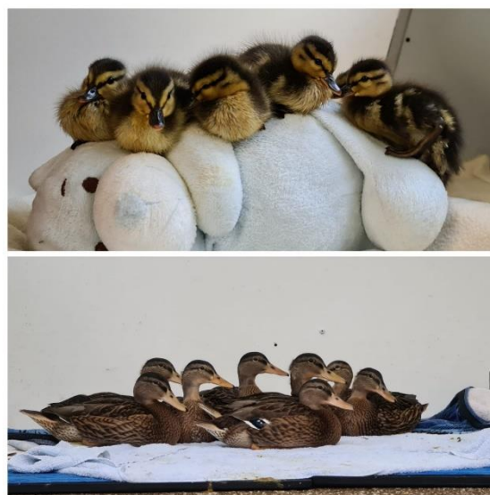
Figuur 5 Eenden van jong naar volwassen, zie toelichting foto's voor meer info

Daarnaast mogen wij eens in de zoveel tijd gratis voer en dierbenodigdheden ophalen bij Stichting Dierenlot. Dit heeft onze voerkosten aanzienlijk omlaag gebracht. Stichting Dierenlot heeft in 2021 de opvang met 6000 euro extra ondersteund.