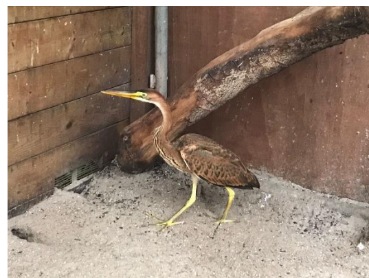
Figuur 1 Een jonge purperreiger. Zie toelichting vogels voor meer informatie.