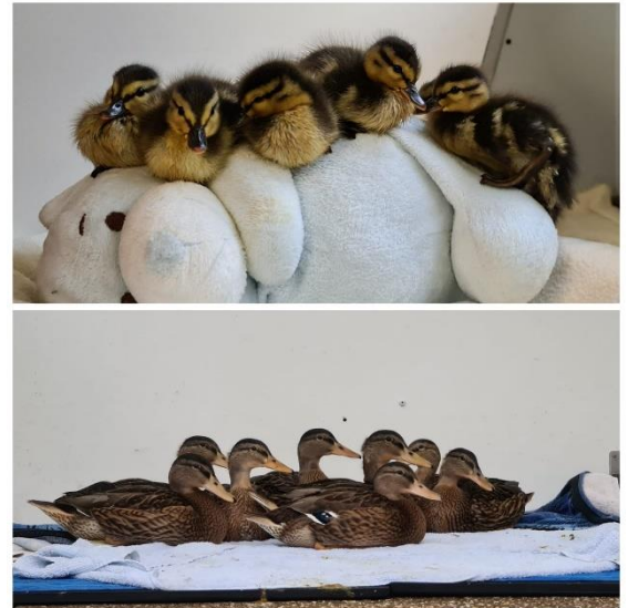
Figuur 5 Eenden van jong naar volwassen, zie toelichting foto's voor meer info

Daarnaast mogen wij eens in de zoveel tijd gratis voer en dierbenodigdheden ophalen bij Stichting Dierenlot. Dit heeft onze voerkosten aanzienlijk omlaag gebracht. Stichting Dierenlot heeft in 2021 de opvang met 6000 euro extra ondersteund.