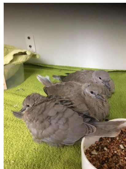
Figuur 6 Jonge Tortels, zie toelichting foto's voor meer info

Rotsoord 24a 3523 CL Utrecht Telefoon: 030-251 72 55 E-mail: info@vogelopvangutrecht.nl www.vogelopvangutrecht.nl