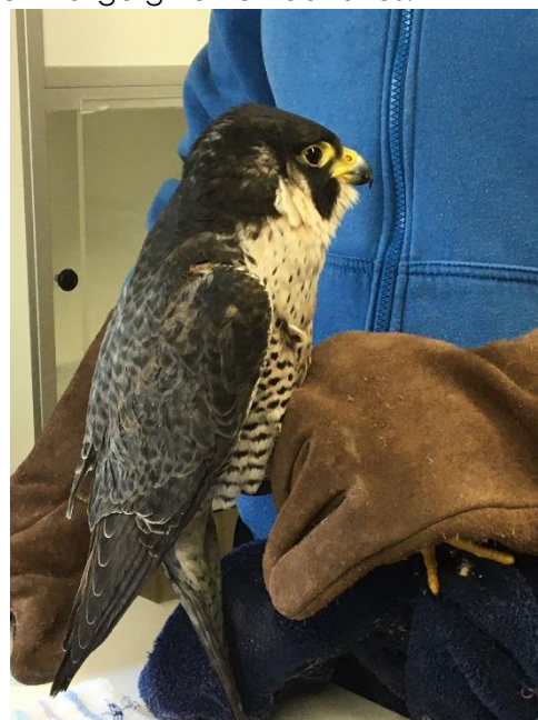
Figuur 2 Havik, zie toelichting foto's voor meer info

In verband met corona is de voorlichting ook in 2021 tijdelijk stopgezet.